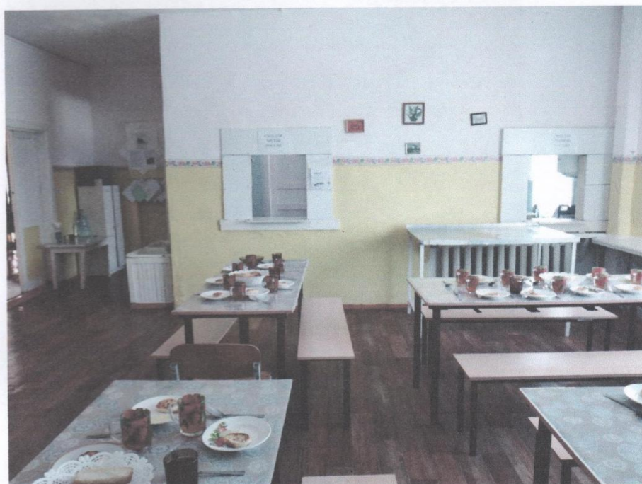
Фото № 7 Зона целевого назначения объекта (зал для приема пищи)