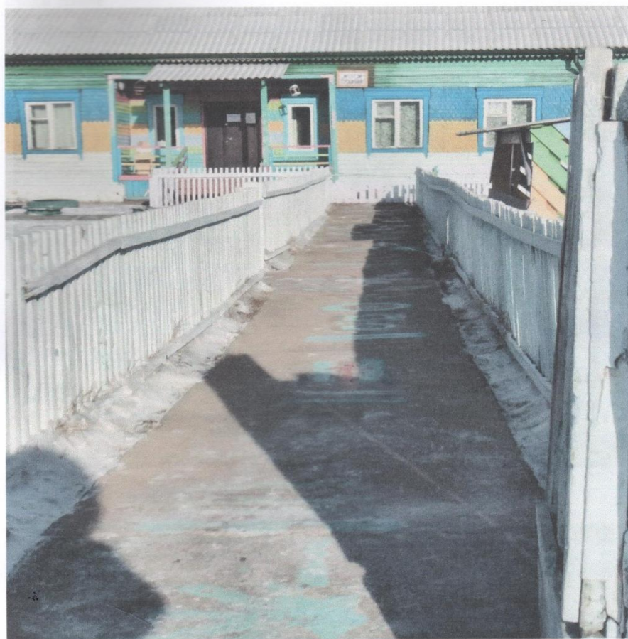
Фото № 1 Территория, прилегающая к зданию